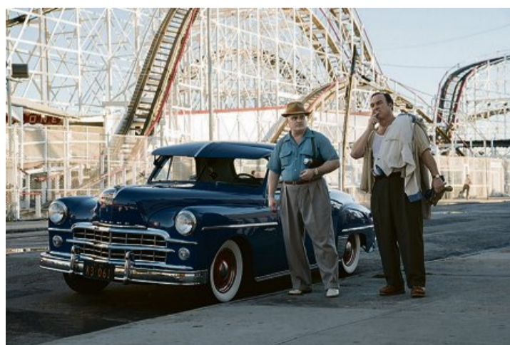
Gepflegter tragischer Graus: Der neue Film von Woody Allen.

Da ist die Tragödie der Ex-Schauspielerin Ginny (Kate Winslet; sie spielt fantastisch), der es nicht an der Wiege gesungen wurde, dass sie jetzt Austern servieren und Fische ausnehmen muss. Die ihres Mannes, des Säufers Humpty (James Belushi; er wirkt tatsächlich ein wenig wie der Humpty Dumpty im Kinderreim: zerbrechlich wie ein Ei), dem der Traum vom Familienleben im-